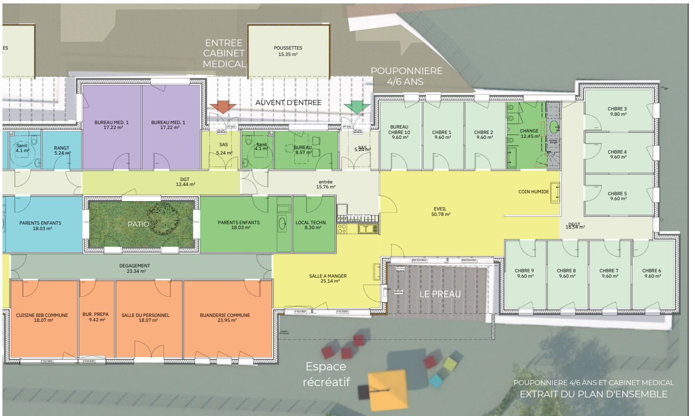
POUPONNIERE 4/6 ANS ET CABINET MEDICAL EXTRAIT DU PLAN D'ENSEMBLE