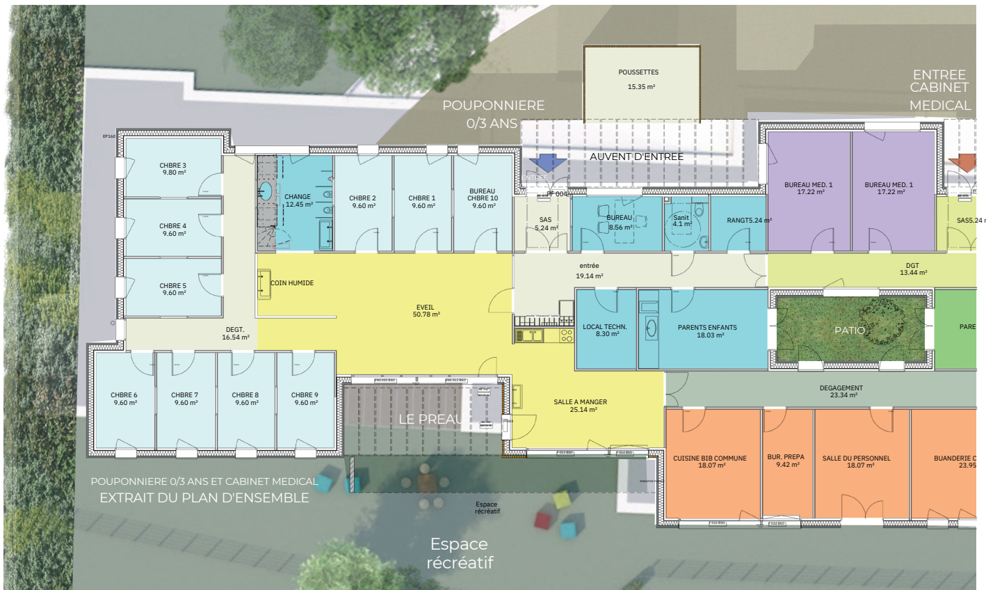
POUPONNIERE 0/3 ANS ET CABINET MEDICAL EXTRAIT DU PLAN D'ENSEMBLE