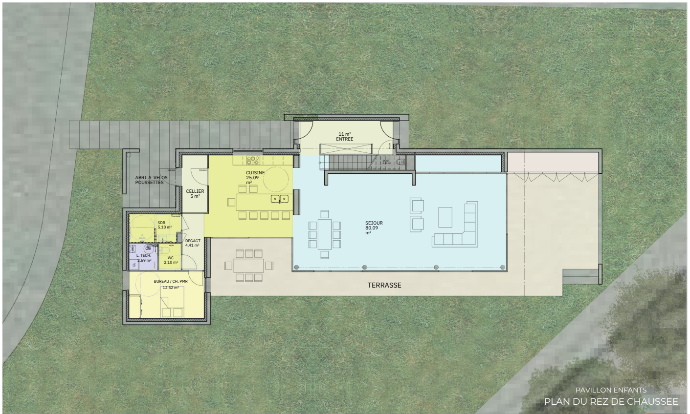
PAVILLON ENFANTS PLAN DU REZ DE CHAUSSEE