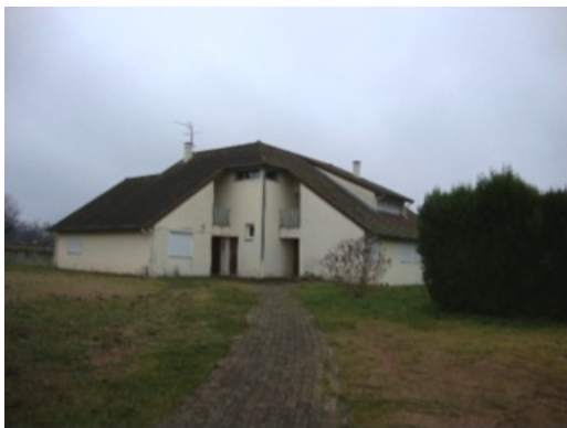
Gendarmerie de Semur-en-Brionnais