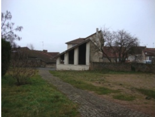
Gendarmerie de Semur-en-Brionnais