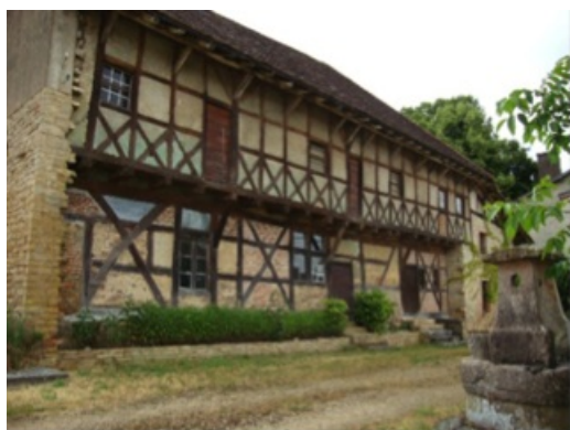
La Maison du Grainetier à Romenay