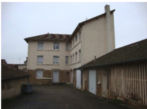
Gendarmerie de Semur-en-Brionnais