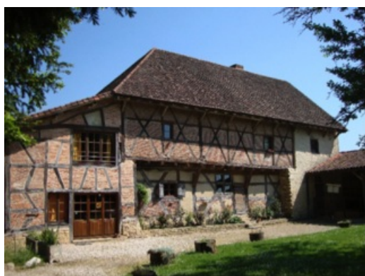
La Maison du Grainetier à Romenay

Si une offre vous intéresse, et quel que soit votre projet d'acquisition, vous pouvez contacter la Direction du Patrimoine du Département.