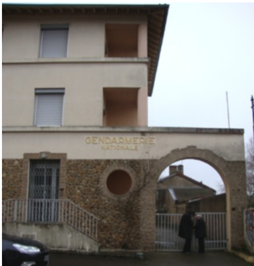
Gendarmerie de Semur-en-Brionnais

Si cette offre vous intéresse, vous pouvez contacter par mail la Direction du Patrimoine du Département : dpmg@saoneetloire71.fr